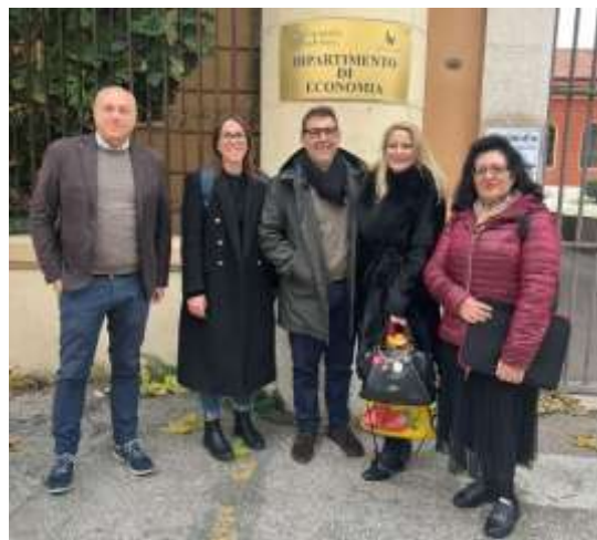
Фиг. 3. Снимка след срещата с колегите от Факултета по икономика

Срещата от 11:30 беше в Ректората на университета, където се проведе дискусия с колеги от сектор „ International Major Projects “ в University of Foggia . Преди началото на срещата екипът ни беше официално приет от Ректора на университета – фиг. 4., което беше знак за ползотворен резултат от бъдещите срещи.