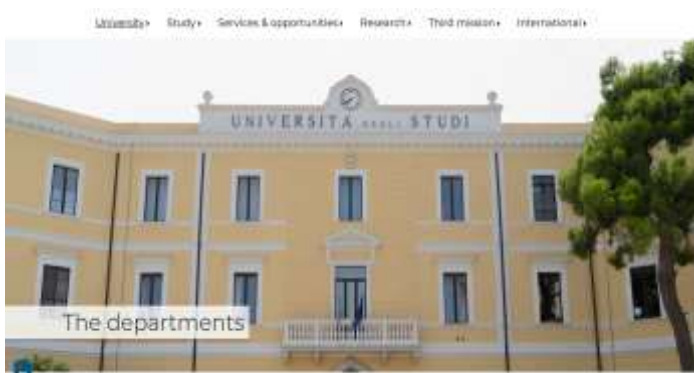
Фиг. 2. Факултета по икономика, University of Foggia, Italy https://www.unifg.it/en/university/governance/departments