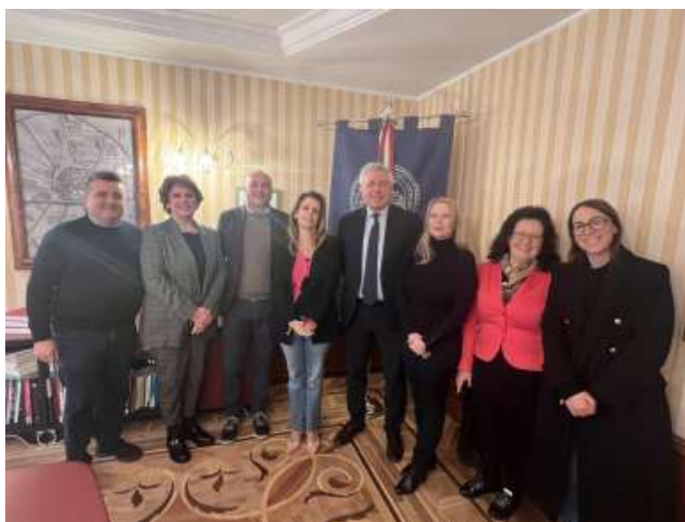
Фиг. 4. Посрещане в Ректората на в University of Foggia, Italy

Срещата от 11:30 беше в Ректората на университета, където се проведе дискусия с колеги от сектор „ International Major Projects “ в University of Foggia . Преди началото на срещата екипът ни беше официално приет от Ректора на университета – фиг. 4., което беше знак за ползотворен резултат от бъдещите срещи.