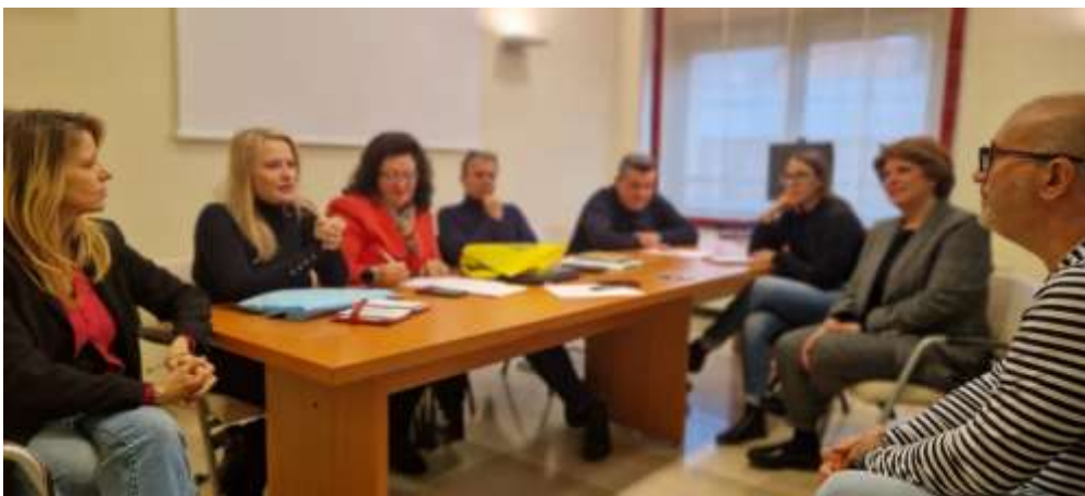
Фиг. 4. Среща с екипа на „Grant office“, University of Foggia, https://www.unifg.it/it/terza-missione/rapporti-con-il-territorio/grant-office