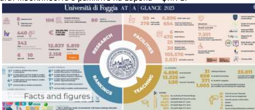
Фиг. 1. Факти за University of Foggia

Първото посещение, което екипът осъществи беше с учени от University of Foggia, гр. Фоджа, Италия (Приложение 1. – Снимки от посещението във Фоджа, Италия). Университетът във Фоджа (UNIFG) е създаден през 1999 г. с указ на „Министерството на университетите и научните изследвания“ на Италия. Има шест академични факултета: Факултет по икономика, Факултет по право, Факултет по клинична и експериментална медицина, Факултет по медицински и хирургически науки, Факултет по селскостопански науки, храни и околна среда и Факултет по хуманитарни науки, който включва изучаване на литература, културно наследство и образователни науки, а от академичната 2021/2022 уч. година и седми факултет - DEMET. Университетът предлага обучение в разнообразни програми и образователно-квалификационни степени за приблизително 14 000 студенти. Има около 460 преподаватели, 35% от които са под 40 години. Има споразумения с 20 чуждестранни университета за обучение на студенти, както и чрез различни програми Сократ/Еразъм, Леонардо и ТЕМПУС, които подпомагат мобилността в рамките на Европа – фиг. 1.